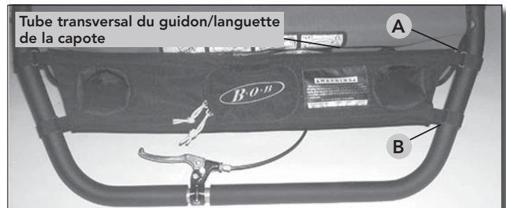
Fig 1 Orientation de la console