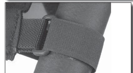
Fig 4 Bande velcro attachée